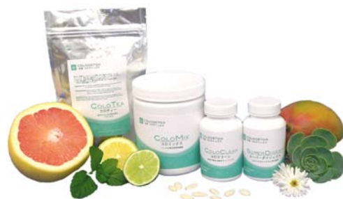
腸簡単、即効性抜群の腸の大掃除「祝便 コロデトックス」

また、多くの人が、これらの症状が、腸の不調から来ているということを知らないのです。真の健康を得るには、まず、「腸の大掃除」をし、腸内環境をきれいに、そして、健全に保つことをお勧めします。