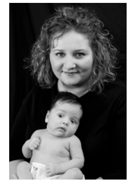
念願だったお母さんになれたマキャナ親子。

あだ名は“禅ベビー”、3ヶ月。いつもニコニコ、穏やかで、ほとんど泣いたり、痙攣を起こさない。毎日8-10時間睡眠で、朝まで一度も起きない。チャアブルで栄養補強も開始！