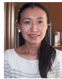
栄養補強と腸のクレンジングの相乗効果で、お肌つるつる、腸(超)美人になった、ぴあすみーるさん。

ぴあすみーるさんのブログ： http://plaza.rakuten.co.jp/piasumiru/