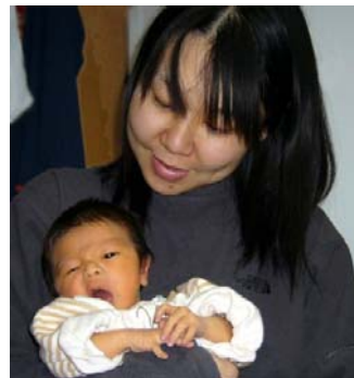
重度の鬱を見事に改善。育児、家事、PTAにと大活躍の3児の母。

一連の娘の出来事で、われわれ夫婦も多くのことを学ばせてもらい、それだけで一冊の本になるほどの苦しい経験もさせていただきました。すべてに感謝で、私共の体験を分かち合うことで、皆さんのお役に立てば幸いです。