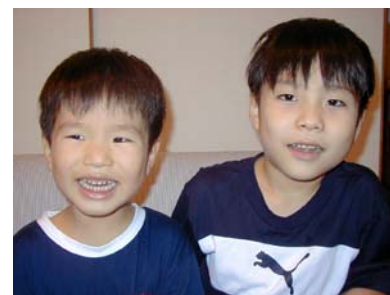
タカヤ君とタイチ君(長男)

長男は凄い好転反応を乗り越え、言葉の面も栄養補強を始める前は、話す意欲が全く無かったのですが、現在は一生懸命言葉を発する様子が出て、促してあげると、すつと言える言葉が増えてきました。