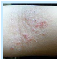
チュアブル開始後1ヶ月 (解毒前)

ハンドルネーム: みいMOON「自然な生活～ナチュラルライフ～」 http://plaza.rakuten.co.jp/naturalelavita/