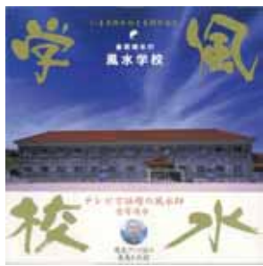
著書「風水学校」／祥伝社出版

風水ブームで様々な情報が氾濫している昨今。そんな中、「本物の風水」を伝えてられる、金寄靖水先生が、フジTVの人気番組「こたえてちょーだい」の風水特集で、すっかりお馴染みに！