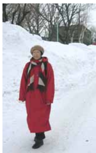
リュックを背負い通学中の母。見た事のあるマフラーと思ったら、なんと私の高校時代の物！

この間もテレビで盲導犬のことがでていましたが、自分を犠牲にしてまで飼い主のためにつくすのを見て本当に涙が出てきました。毎日色々な事件がおきていますが、一人一人が本当の愛情を持って接すればもう少しよくなると思います。