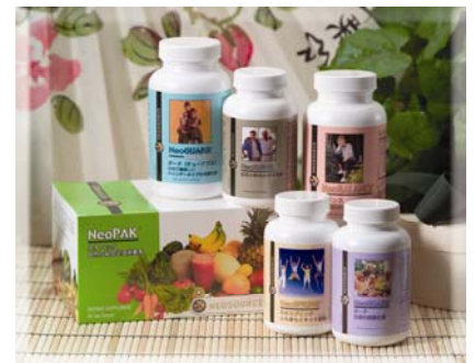
（人生を好転させる栄養補強食品）