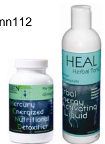
（日本人用に特別に作られた解毒食品ヒールとmend）