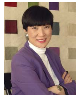
最近、雅代さんが大発見した、3つの世界最新実践情報とは何かな？