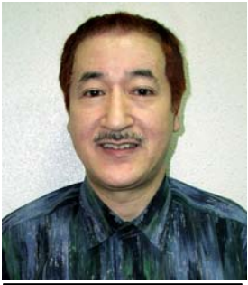
辺泥先生のアジャストと 私達の自然治療で 鬼に金棒！

「後一つ健康への鍵があるはず」と本能的に、意識の深い所で何かを探し求めて、遂に大発見！！