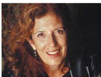
ボディーショップ創始者の アニタ ローディック女史

If you think you're too small to have an impact, try going to bed with a mosquito in the room. (Anita Roddick)