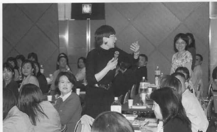
200名を集めて情熱と熱気ムンムンだった、昨年4月の講演会（東京）。雅代さんの講演会で人生が180度好転した人もたくさん紹介された。

W いまの元気な姿からは想像できないが、実は雅代さんは小さいころから体が弱かったという。そのため、「余分な苦勞をさせないよう」といってご家庭の配慮から、北