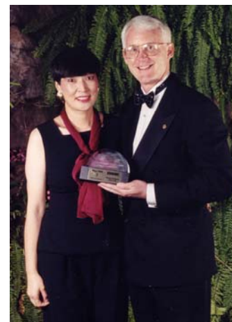
雅代さんとロブさん、ある表彰式で。