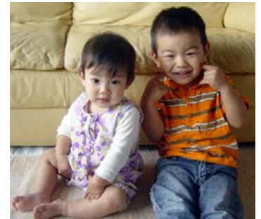
可愛くて、健康な妹が増えた、賢い栄養補強で、優秀で活発な上の二人！

栄養補強との出会いに感謝するとともに、これからも、楽しく元気いっぱい子育てをしていきたいです。