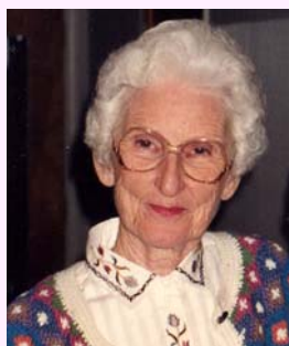
ロブさんのお母さん。