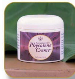
ファイコティン クリーム

アトピーやアレルギー肌、敏感肌の方は、マッサージやパックなどの刺激を加えずに、ファイコティン クリームを塗る事から始めましょう。また栄養補強・解毒をしながら、同時に使っていくことが解決への近道です。