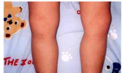
お肌つるつるのダイ君