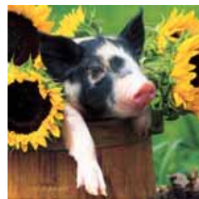
注：上記写真は実物のベーコンではありません。

この主人の喜びの叫びで、ベーコンは“ベーコンにならなかったベーコン”と色々なニュースで報道され、一躍有名なブタになってしまったとさ。めでたし、めでたし。 ロブ・ジョリー(雅代さんのご主人)記